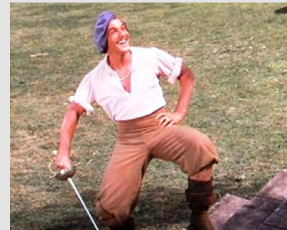
Gene Kelly- 1948

cace et qui n'est doublée à aucun moment. Enfin, nous avons regardé « Le masque de Zorro » où Antonio Banderas alias Zorro, est confronté au gouverneur et au Capitaine Love ainsi qu'à la fille du gouverneur. Une escrime de sabre est davantage mise en avant avec des mouvements rapides et des techniques de captation différentes en fonction des personnages, sans oublier la désinvolture et l'aisance du héros.